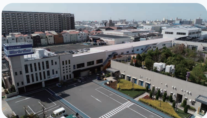
大阪本社工場(大阪府)